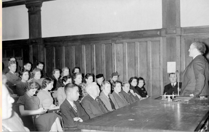
Cours magistral à la Sir George Williams University