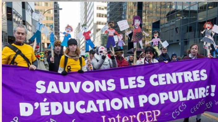
Manifestation contre l'austérité 2015