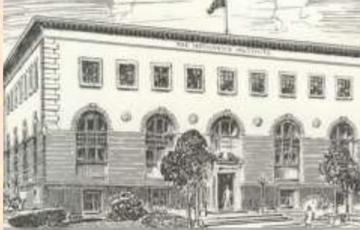
Mechanics' Institute ou Institut des artisans