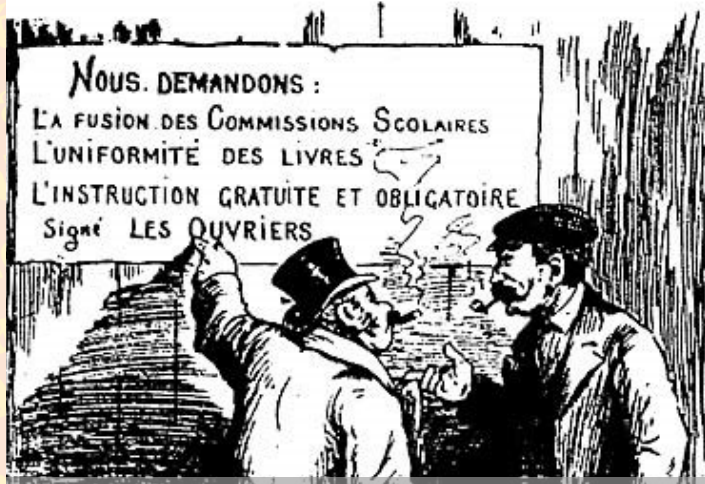
Dessin publié dans le journal Le Pays, 4 mars 1911