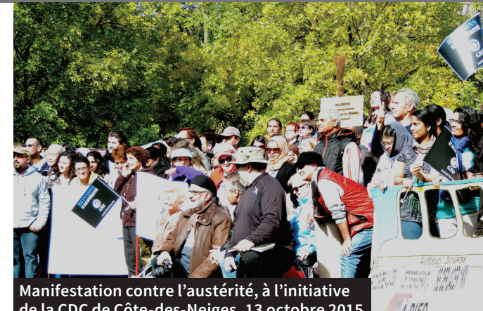
Manifestation contre l'austérité, à l'initiative de la CDC de Côte-des-Neiges, 13 octobre 2015