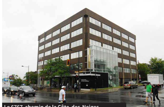
Le 6767, chemin de la Côte-des-Neiges, Montréal, abrite la bibliothèque interculturelle et le centre communautaire