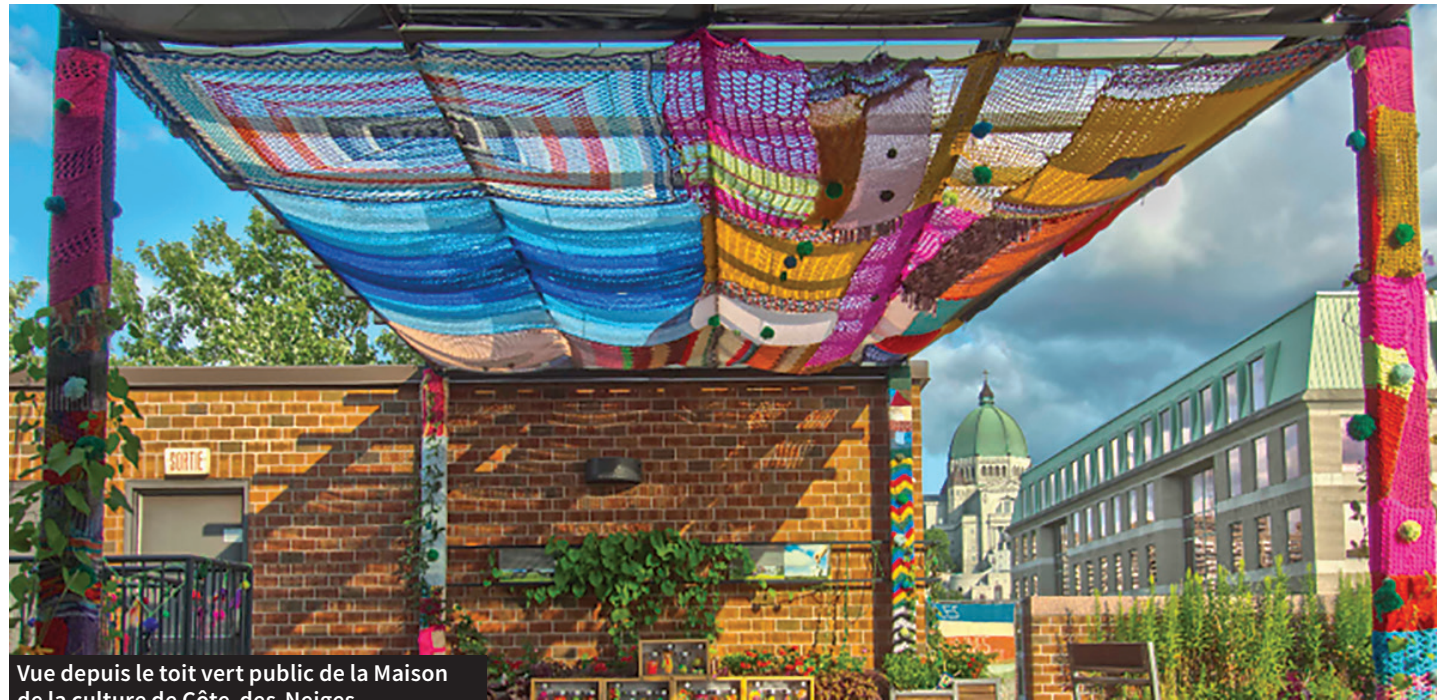
Vue depuis le toit vert public de la Maison de la culture de Côte-des-Neiges