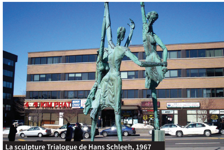
La sculpture Triologue de Hans Schlee, 1967