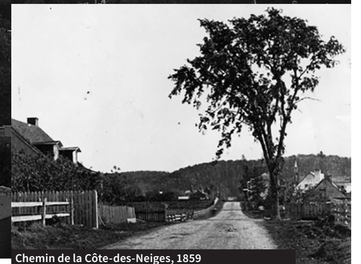
Chemin de la Côte-des-Neiges, 1859