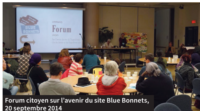
Forum citoyen sur l'avenir du site Blue Bonnets, 20 septembre 2014 Photo : Rayside Labossière – CDC de Côte-des-Neiges.